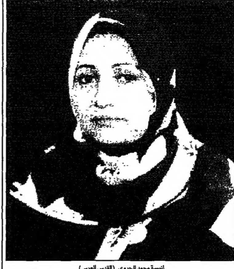
صفحة 1 - مكتب الرئيس العربي - من عرافة حسن الخوياري

تتمتع من اليمن وتعمل حالياً مديرة لادارة الاحزاب في مكتب رئاسة الجمهورية. وهي خبيرة اقتصاد وعلوم سياسية وتربوية سابقة وعملت لخصائياً اعلامية في مكتب رئاسة الجمهورية أيضاً. كما انها ناشطة في العمل الاجتماعي والسياسي وعضو بارز في جمعية لادارة المينية ولها برامجها النضالية في الجمعيات الخيرية بطرق الانساني. وتتمتع حالياً لخوض انتخابات 27 من نيسان (أبريل) البرلمانية في اليمن كمرشحة مستقلة في الدائرة 85 بمدينة اب الوالدية شرق العاصمة اليمنية صنعاء على بعد حوالي 170 كم.